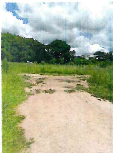
CONFLUENCIA DA RUA PROJETADA COM RUA RUBENS MARQUES