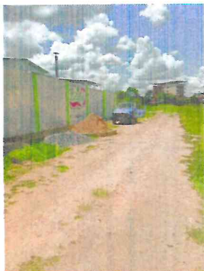
RUA RUBENS MARQUES