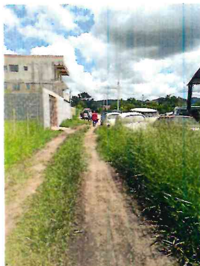
RUA HAMILTON XAVIER MARQUES