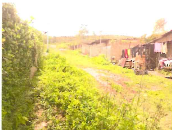
Rua Marina Loech dos Santos