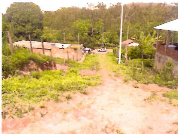
Rua Marina Loech dos Santos