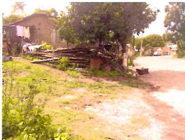
Rua Antônio Bernardino da Silva