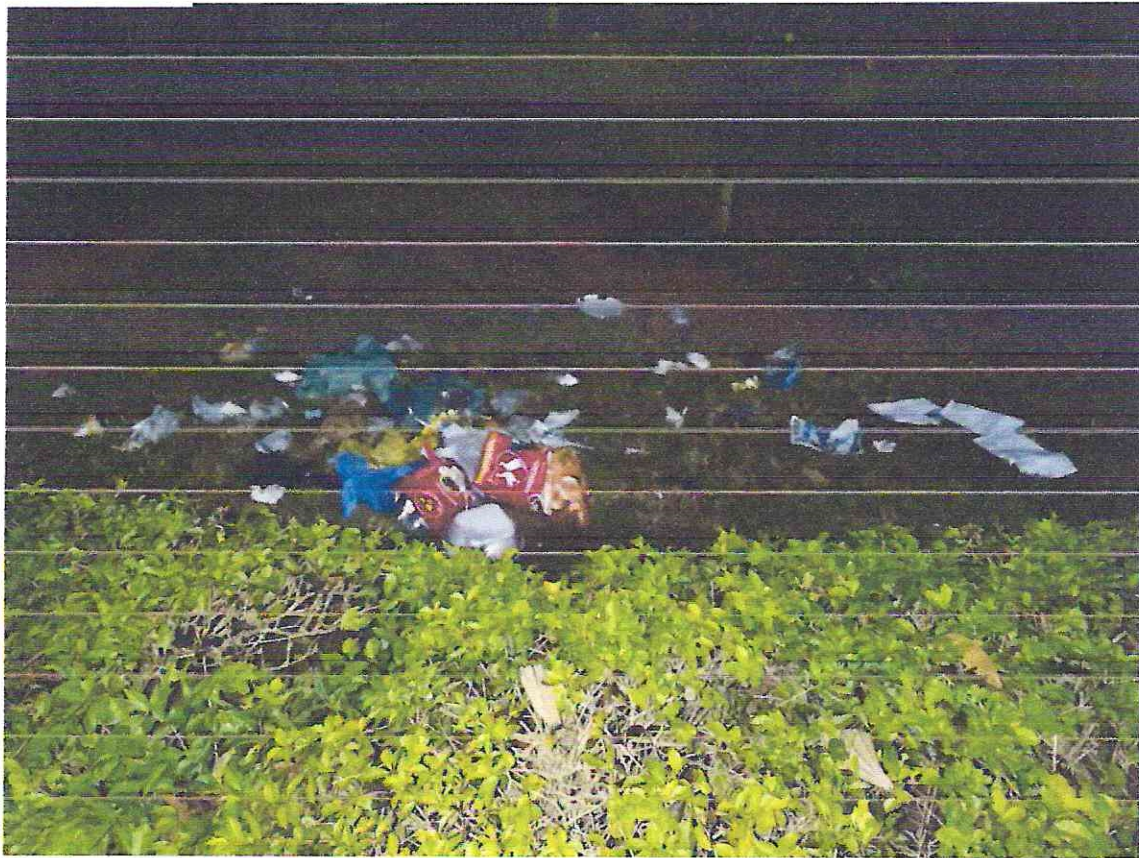
Foto 05: Resíduo domiciliar depositado na Praça da Rodoviária fora de horário de coleta, em desacordo com o Código de Posturas Municipal.