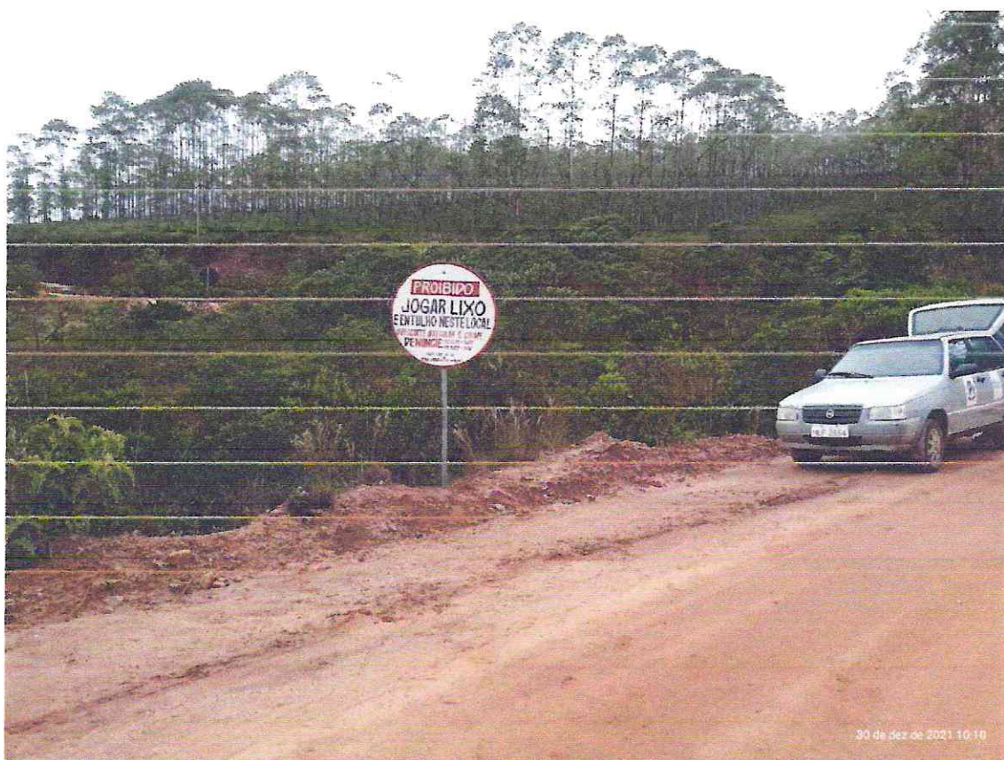
Foto 01: Colocação de Placa de Proibido Jogar lixo na localidade Buraco do Inferno.