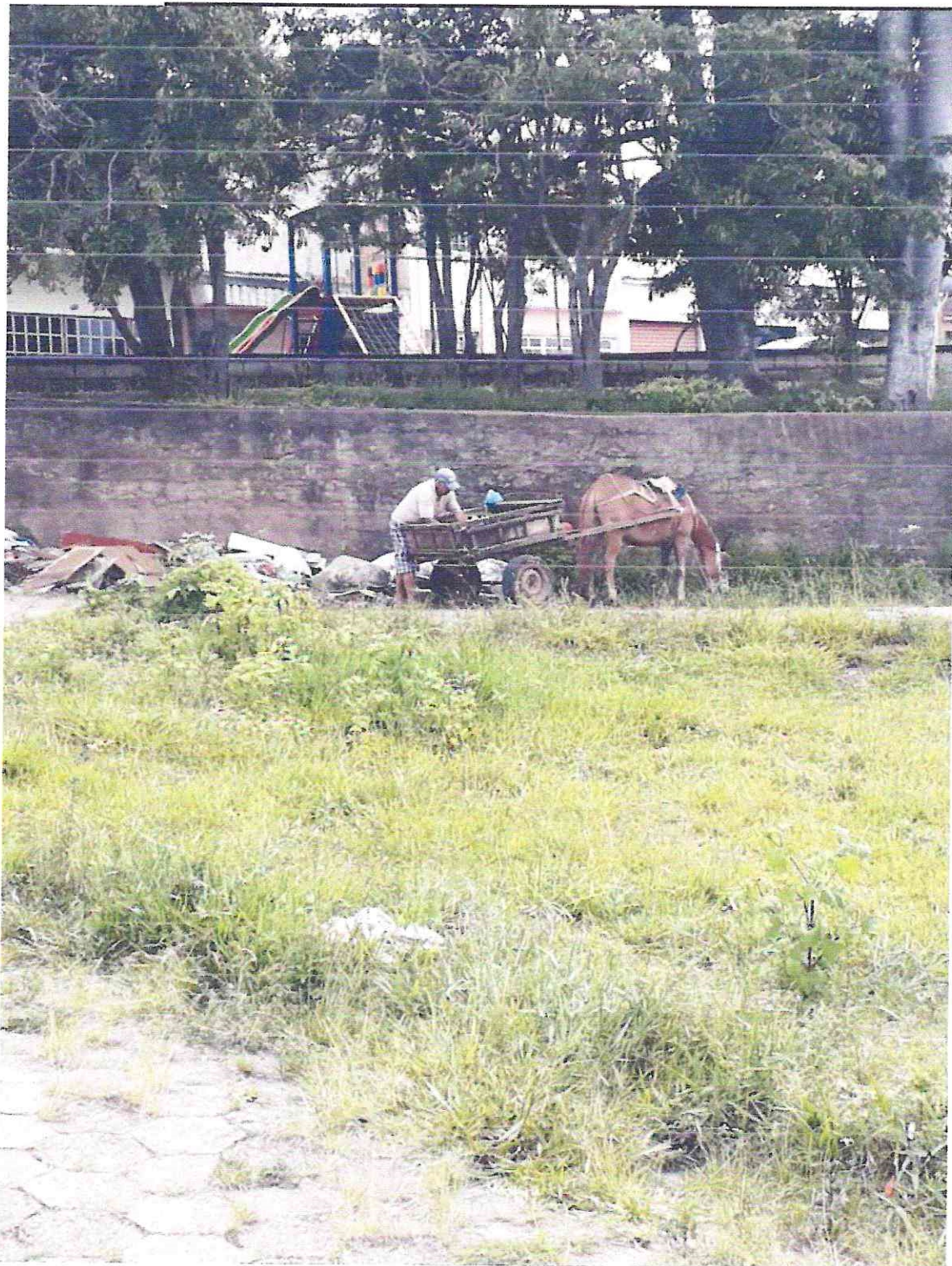
Foto 04: Carroceiro descartando resíduos volumosos às margens de via pública.

Secretaria Municipal de Agricultura, Pecuária e Meio Ambiente Praça Ex-Combatentes, nº 200, Bairro Niterói Bom Jardim de Minas – MG – CEP: 37310-000 Tel: (32) 3292-1438 E-mail – agricultura@bomjardimdeminas.mg.gov.br